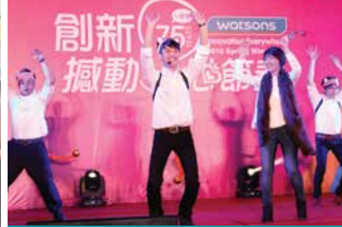
台灣屈臣氏 - 春日美酒派對