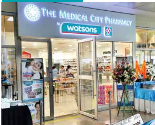
醫院門診藥房店舖形式