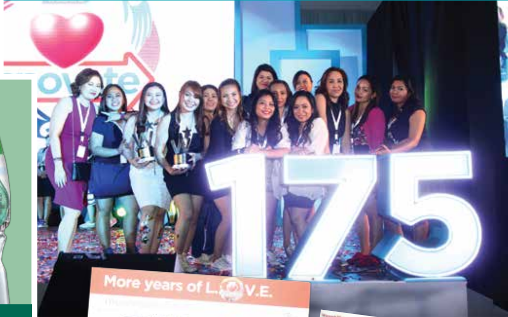
菲律賓屈臣氏 - 全國銷售會議