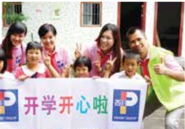
中國百佳超級市場－關愛農村兒童活動