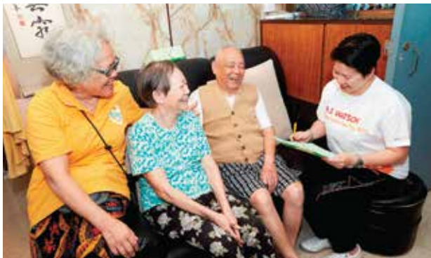
屈臣氏集團香港總部－長者探訪