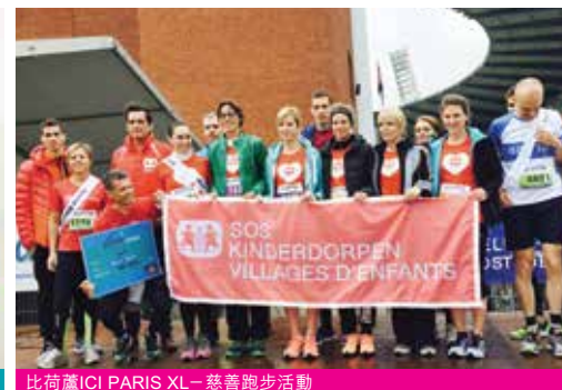
比荷蘆ICI PARIS XL - 慈善跑步活動