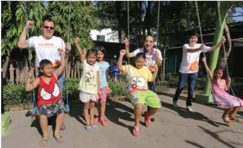
泰國屈臣氏－社區健康公園計劃