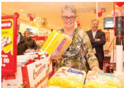
為慶祝荷蘭坎彭、厄厄嫩及法爾肯斯瓦德新店開張，Kruidvat與當地慈善機構合辦一分鐘慈善購物活動，幫助經濟有困難的居民