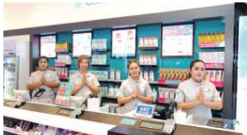
泰國屈臣氏於Central Pinklao百貨商店開設現代化G7店舖。為提升顧客的購物體驗，店舖設計加入時尚及充滿活力的元素，讓顧客可於更舒適的環境中購物