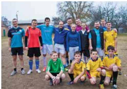
烏克蘭屈臣氏 - 探訪寄宿學校