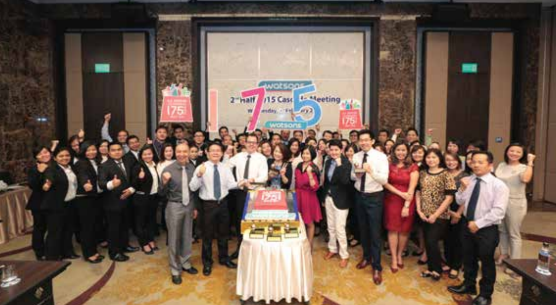
泰國屈臣氏－公司會議