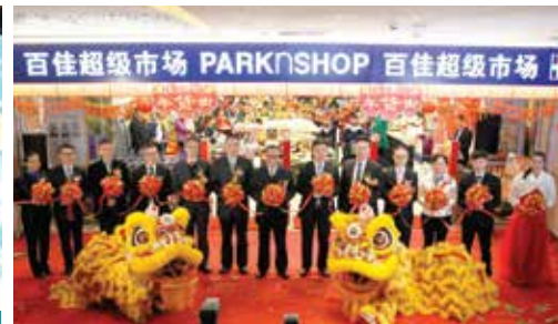
中國百佳超級市場於廣州開設新店，為顧客帶來一系列優質產品及愉快的購物體驗