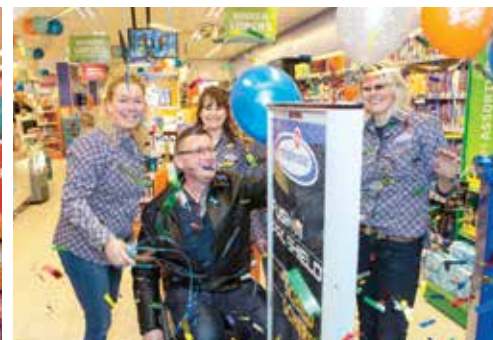
為慶祝荷蘭貝弗韋克及奧特霍倫新店開張，Trekpleister向一家以傷殘人士為服務對象的慈善機構捐款