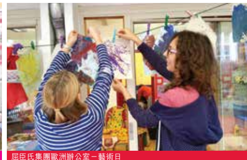
屈臣氏集團歐洲辦公室 - 藝術日