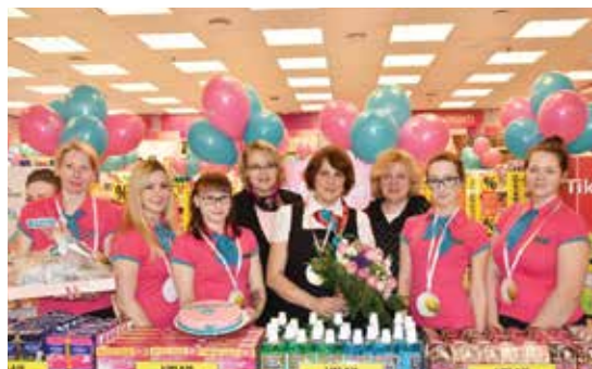
為拓展業務網絡，Drogas於里加及維爾紐斯開設新店