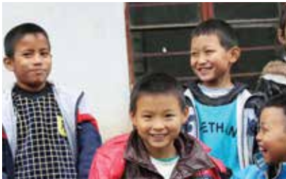
中國屈臣氏－教育支援計劃