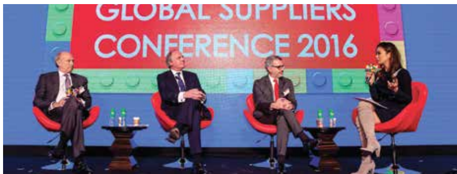
頂尖供應商就「追求創新及持續增長」進行討論 (左起) 歐萊雅主席兼行政總裁Jean-Paul Agon、聯合利華行政總裁Paul Polman、Puig主席兼行政總裁Marc Puig