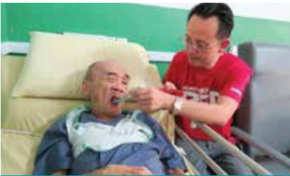
新加坡屈臣氏－探訪長者