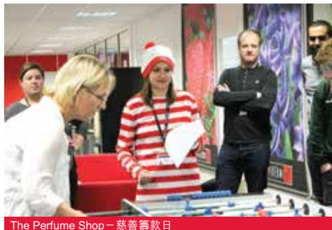
The Perfume Shop - 慈善籌款日