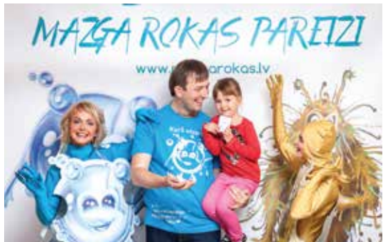
拉脫維亞 Drogas - 全球潔手日