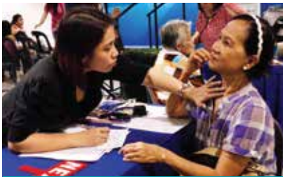
菲律賓屈臣氏－健康檢查日