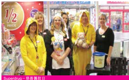
Superdrug - 慈善籌款日