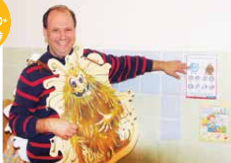
立陶宛 Drogas - 全球潔手日