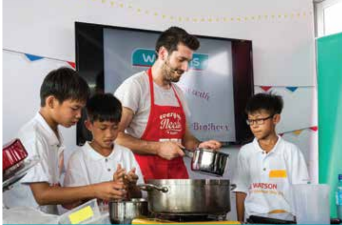
馬來西亞屈臣氏－兒童烹飪班