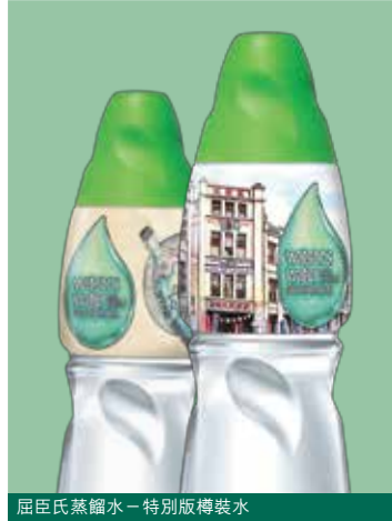
屈臣氏蒸餾水 - 特別版樽裝水