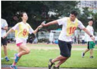
台灣屈臣氏－愛你不肺力運動日