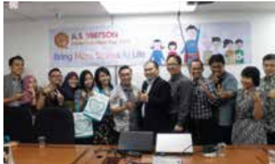
印尼屈臣氏－免費健康檢查