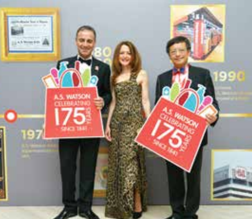
土耳其屈臣氏 - 屈臣氏美容及個人護理大獎