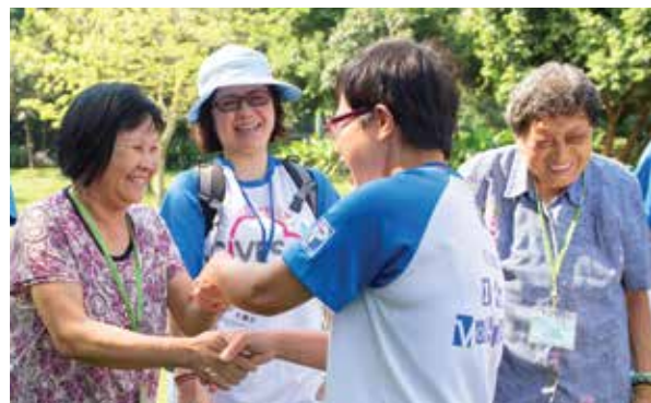
香港百佳超級市場－長者外出活動