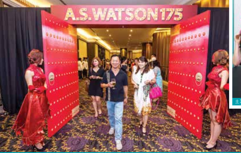
馬來西亞屈臣氏 - 「健康美麗大賞」頒獎典禮