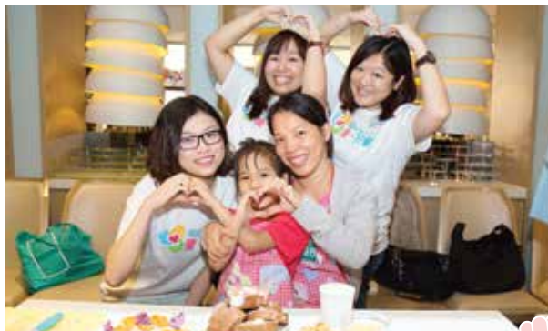
香港屈臣氏－單親家庭烹飪同樂日