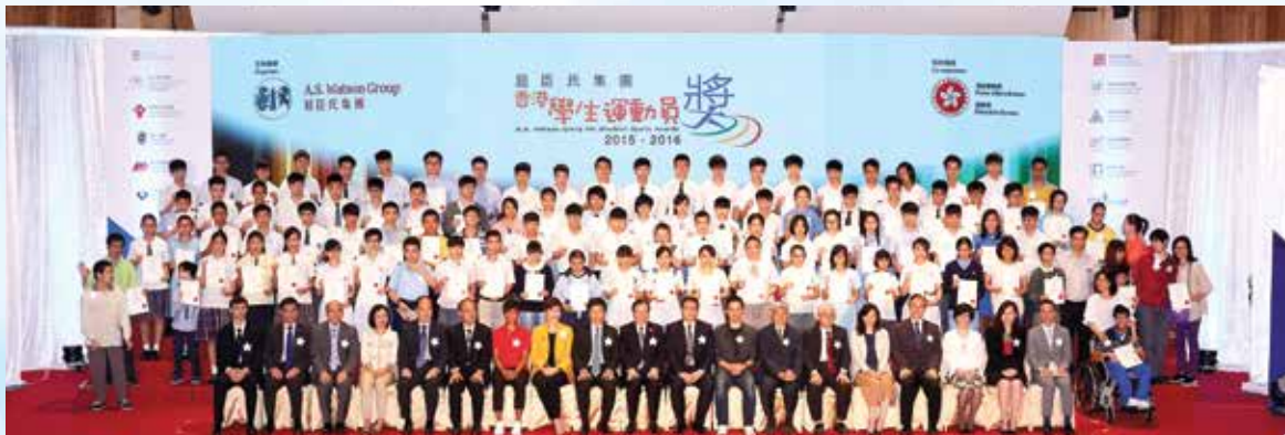
「香港學生運動員獎」踏入第十一年，中聯辦宣傳文體部李冰處長（前排右九）、屈臣氏集團董事總經理黎啟明（前排中間）、屈臣氏集團首席營運總監倪文玲，JP（前排左八）及民政事務局長康樂及體育科體育專員楊德強（前排左九）與得獎者合照