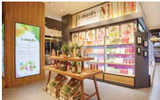
第一家G7店舖於土耳其登場，此店亦是屈臣氏於該國最大的分店