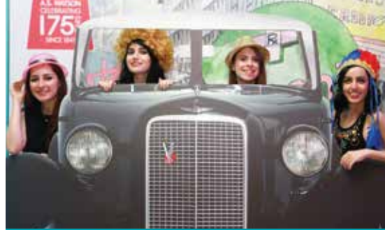
土耳其屈臣氏 - 員工派對