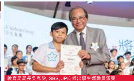
教育局局長吳克儉，SBS, JP向傑出學生運動員頒獎