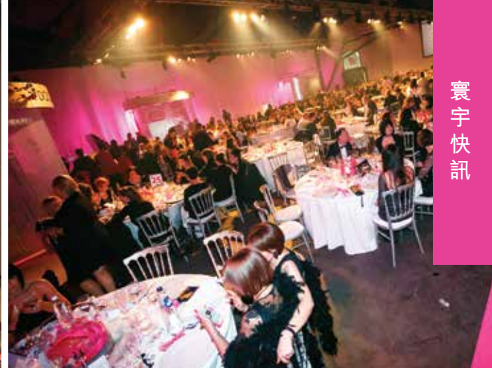
比利時及盧森堡ICI PARIS XL－員工派對