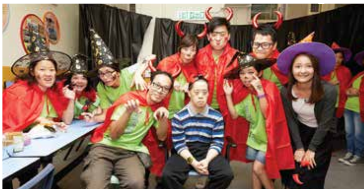
屈臣氏賣業－萬聖節派對